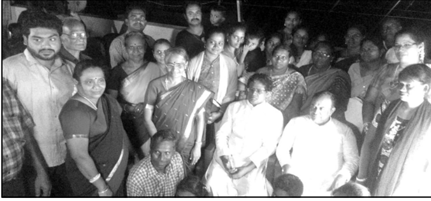
2019 நவம்பர் 13 அன்று கன்னியாகுமரி தோழமை இல்லத்தில் நடைபெற்ற தென்இந்திய மறைமாவட்ட அன்ரியச் செயலர்கள் கலந்துரையாடல் கூட்டம்